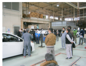
（写真左 ← 検温受付 ・写真中央↑：座学 ・右 → 実技）