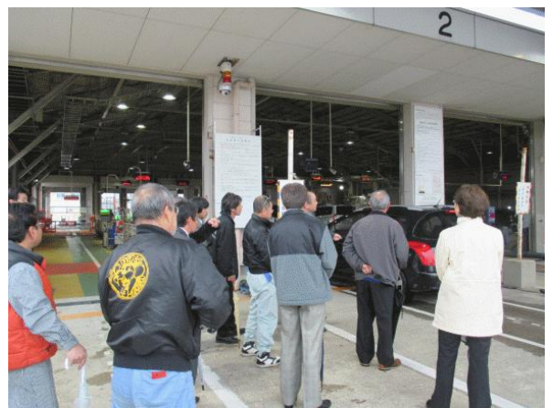
↑↑検査場入口（上部はミスト）