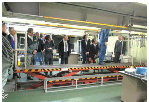
↑↑ピット内の下回り検査