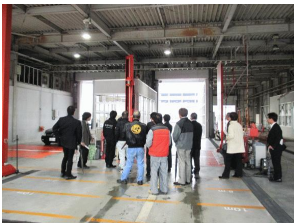
↑↑長さ・巾・重量等の諸元測定コース